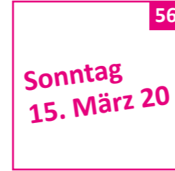
56 Buchner Birgit (52) Kauffrau Pfaffenhofen